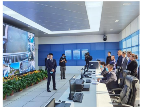
在银川水厂中控室工作人员讲解地表水处理系统

人民群众监督，提高人民群众对政府工作的满意度，银川市市政管理局于2020年10月16日，组织开展“政府开放日”活动，邀请市人大代表、政协委员、群众代表及媒体记者等42余人，参观了银川都市圈工程西线供水工程建设情况。