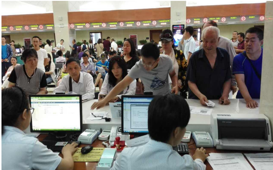
市民一卡通发卡现场